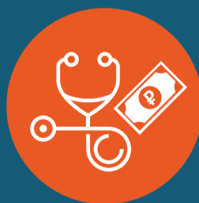
Оплата диагностических процедур