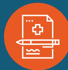
Выписка справок, направлений